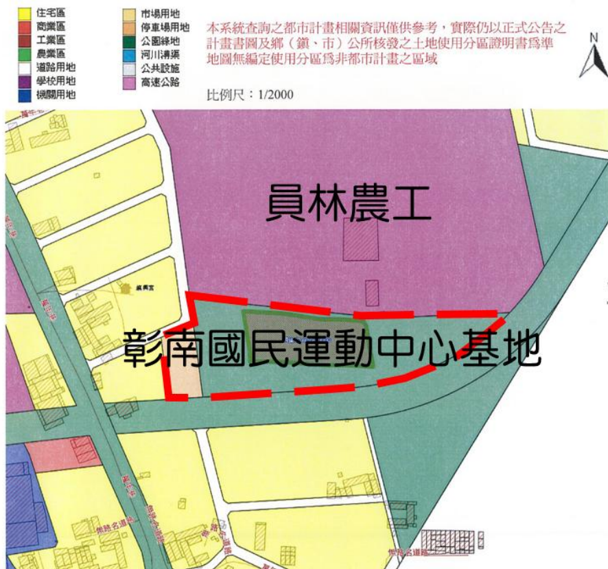
表 3.1 彰南國民運動中心委託經營範圍圖